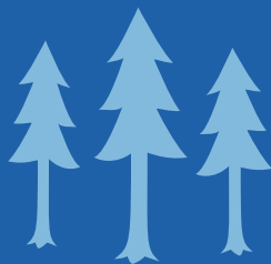
Proteger as Florestas