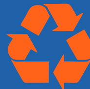
Melhorar a Eficiência

350 é um diagnóstico muito duro, mas é também uma grande oportunidade para reorganizarmos as nossas comunidades de uma forma mais local, saudável e positiva. A 24 de Outubro de 2009, o Dia Internacional de Acção Climática 350, passe à acção mostrando que género de soluções quer ver no mundo. Veja abaixo algumas ideias!